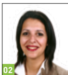
Zakia Khattabi Sénatrice Cheffe de groupe