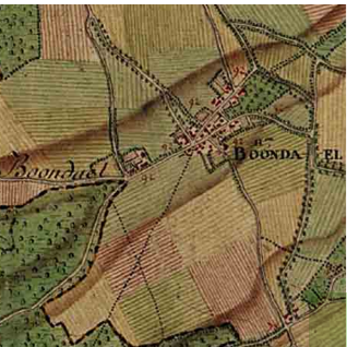
Carte Ferraris, 1777

1870 : nouvelle plaine de manœuvres militaires, édification des casernes.